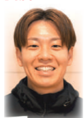
箱根駅伝 三代目山の神 [神野 大地 さん]

9:25~のモノマネ体操や13:40頃のミニライブなど実施予定です! 是非ご参加ください。